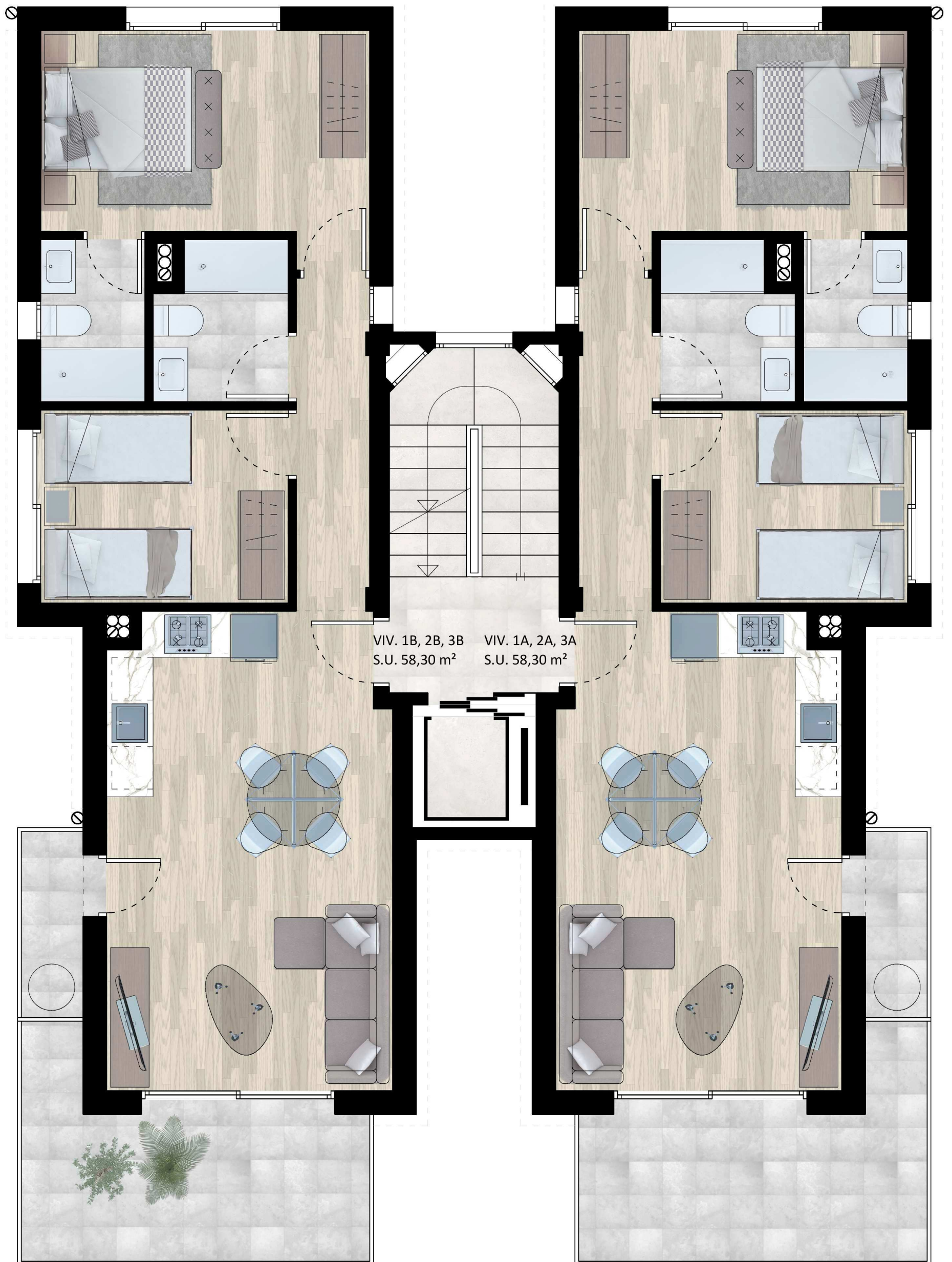
Imagen no contractual sujeta a modificaciones.